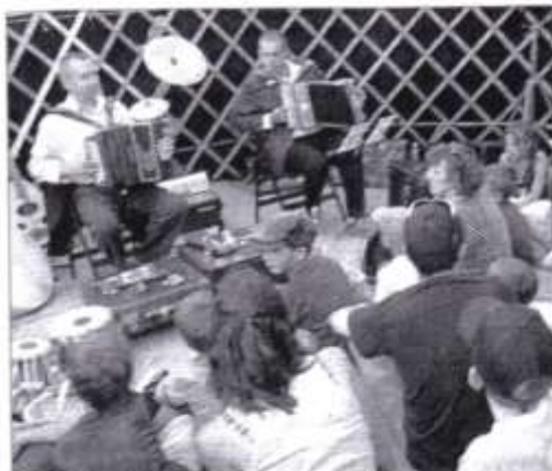
SCÈNE. Des comédiens qui savent jouer et conter.

La troupe « Batahola de la pintura » a joué à guichets fermés, samedi dernier, au cours de la onzième édition de la Fête des parlers.