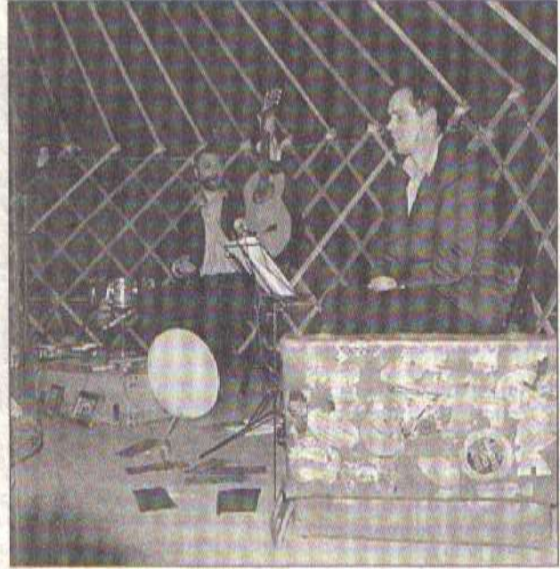
Une valise pleine de contes et légendes d'Auvergne

public de tous âges et les acteurs, tour à tour lecteurs, conteurs et musiciens. Des légendes auvergnates, bien surannées, sorties d'une valise en carton après un tirage de cartes par des spectateurs beaujolais assis sous