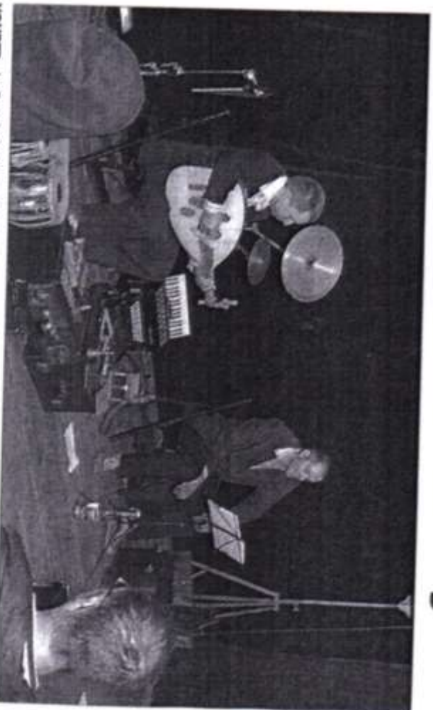
YOURTE. La Batahola invite à un voyage en contes.

Spectacle intime sous la yourte. Il est aussi spectacle pour tous, à partir de 5 ans. ■