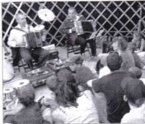
SCÈNE. Des comédiens qui savent jouer et conter.

La troupe « Batahola de la pintura » a joué à guichets fermés, samedi dernier, au cours de la onzième édition de la Fête des paniers.