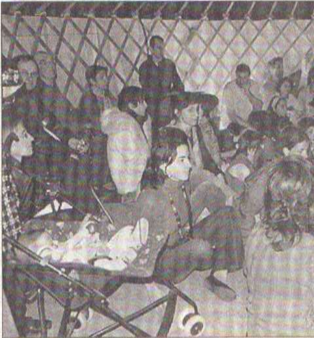
Première séance : la yourte est pleine

E T NON pas contes au coin du feu, mais on s'y serait cru, tant l'intimité créée par la yourte et l'éclairage chaud a évoqué les longues veillées... d'avant l'électricité. Cependant, le courant est très bien passé entre le