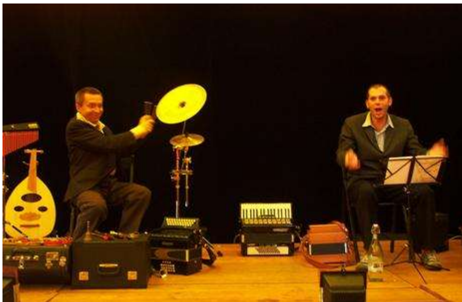
PHOTO DU SPECTACLE